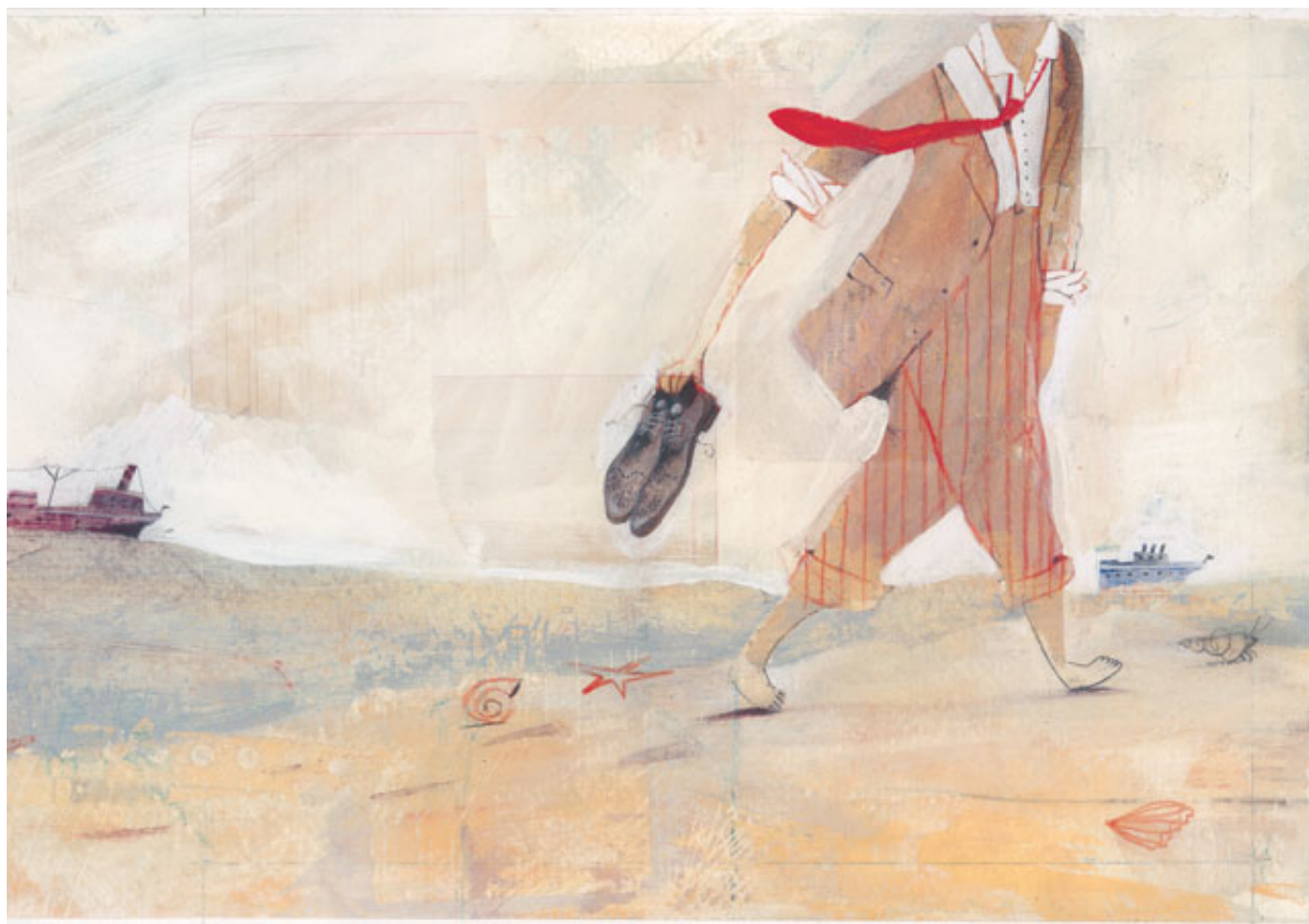
Illustrazione con Svjetlan Junaković