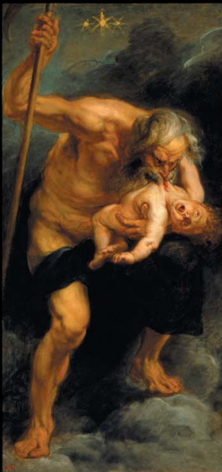
Rubens, Saturne dévorant ses enfants , 1636