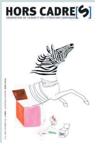
illustration : Audrey Calleja

La revue Hors Cadre[s] , publiée conjointement par l'atelier du poisson soluble, les éditions Quiquandquoi et l'Institut International Charles Perrault, propose des regards croisés de critiques et de créateurs sur la production contemporaine d'albums et, plus généralement, sur les supports associant textes et images.