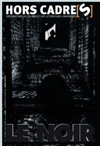
illustration : Lorenzo Mattotti

La revue Hors Cadre[s] , publiée conjointement par l'atelier du poisson soluble et les éditions Quiquandquoi, propose des regards croisés de critiques et de créateurs sur la production contemporaine d'albums et, plus généralement, sur les supports associant textes et images.