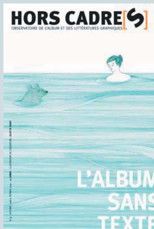
illustration : Juliette Binet

La revue Hors Cadre[s] , publiée conjointement par l'atelier du poisson soluble et les éditions Quiquandquoï, propose des regards croisés de critiques et de créateurs sur la production contemporaine d'albums et, plus généralement, sur les supports associant textes et images.