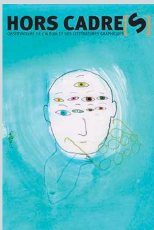
illustration : Hélène Riff

La revue hors cadre[s] , publiée conjointement par l'atelier du poisson soluble, les éditions Quiquandquoi et l'Institut International Charles Perrault, propose des regards croisés de critiques et de créateurs sur la production contemporaine d'albums et, plus généralement, sur les supports associant textes et images.